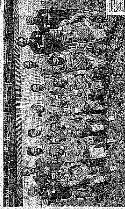
PALLONE PER TUTTI Col torneo di calcio integrato al Braglia

Solidarietà e spettacolo per il primo torneo nazionale di calcio integrato che si è tenuto ieri al Braglia nell'ambito dell'iniziativa "Il Cuore nel Pallone" e che ha visto scendere in campo Nazionali e squadre di calcio integrato formate da ragazzi normodotati e diversamente abili: la Nazionale Italiana Prestigiatore, la Nazionale Italiana Calcio Disc Jockey, la Nazionale Italiana Amici "Gli Angeli della tv", la Nazionale Italiana Senior: Veterani DOP, la Nazionale Italiana Integrata Smile Action, la Nazionale Italiana Doppiatori Fuoridal Set - Gli amici di Luca Zingaretti, la Squadra per l'Emilia-Romagna, Torino e Padova FD, ed infine la Nazionale Italiana Cabarettisti, con la presenza di alcuni cabarettisti di Zelig Off e Zelig Circus. L'iniziativa, che prende il